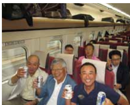
金沢新幹線車中にてカンパイ