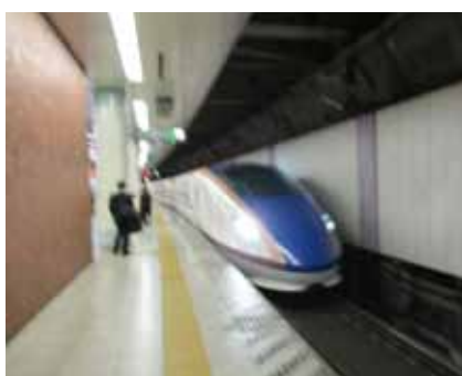
金沢新幹線に乗車