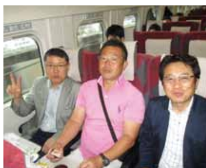
村越会員 米田会員 小池会員