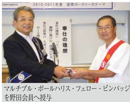
マルチプル・ポールハリス・フェロー・ピンバッジ を野田会員へ授与