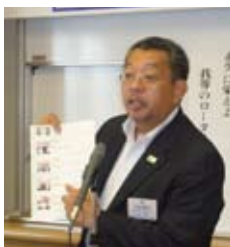
森の町内会 ホームページより

先般卓話を依頼した「森の町内会」のホームページに我孫子ロータリークラブが紹介されました。