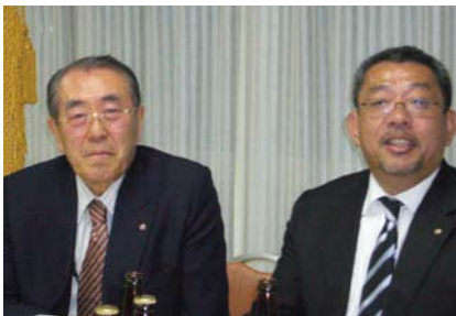
瀧日会員・丸田会員