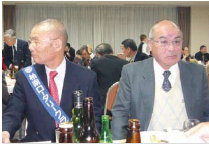
柏南RC戸部会員・志賀会員