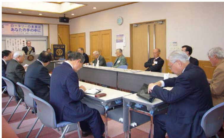
星野会員・渋谷会員