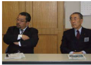
丸田会員・瀧日会員