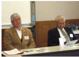
星野会員・渋谷会員