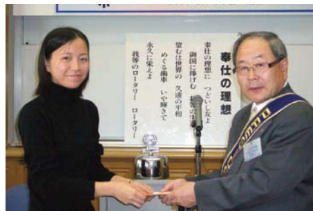
クエンさんに奨学金授与

クレストの料理も大変おいしく頂きました。当日の会費は会の方から負担するというので、個人的にニコニコに寄付させていただきたいと思っています。