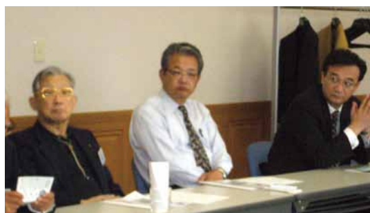
尾上会員・塩毛会員・白石会員