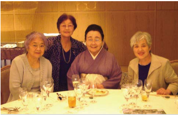
尾上夫人・滝日夫人・小野夫人・上村晃一夫人