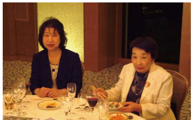
星野夫人・酒井夫人