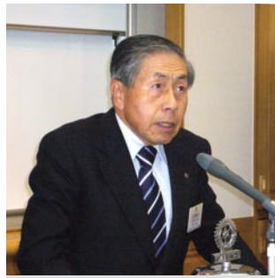
親睦委員会よりお知らせ 立野会員