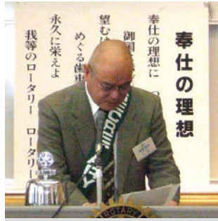
幹事報告 志賀会員