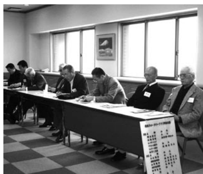
本日の卓話 滝日会員