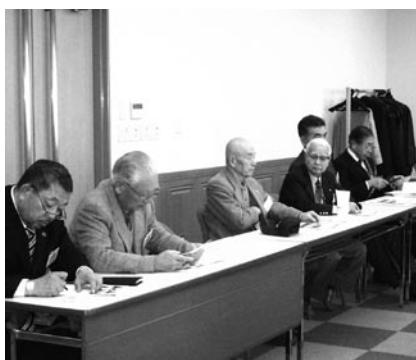
幹事報告 志賀会員