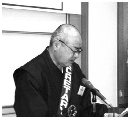
幹事報告 志賀会員