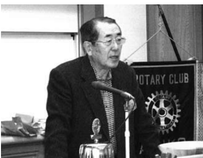
ガバナー補佐報告 滝日会員