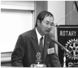
ジャパンバードフェスティバル報告 野田会員