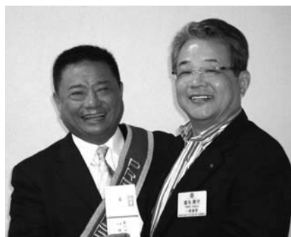
沼南RC高本会長・塩毛会員