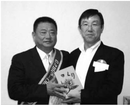
沼南RC高本会長・柏RC神野会員