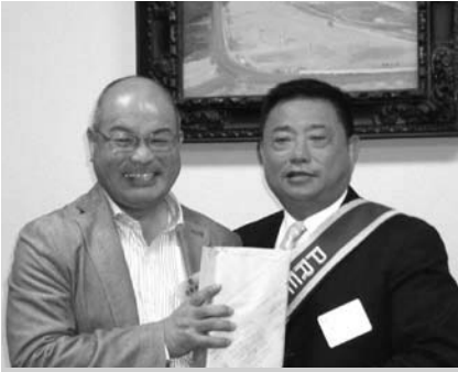
沼南RC高本会長・志賀会員