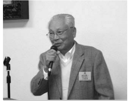
優勝の挨拶! 渋谷会員