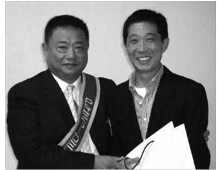
沼南RC高本会長・柏西RC金本会員