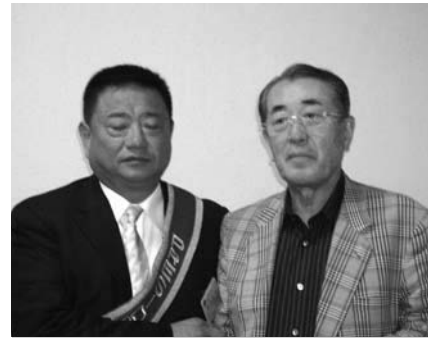
沼南RC高本会長・滝口会員