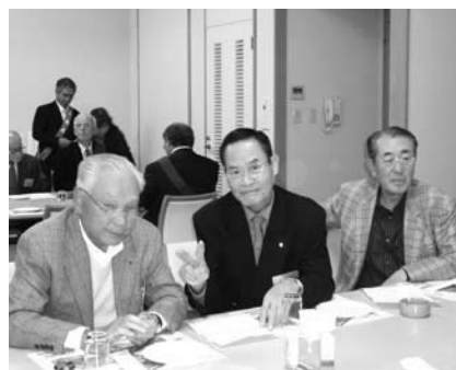
渋谷会員・高島会員・滝日会員