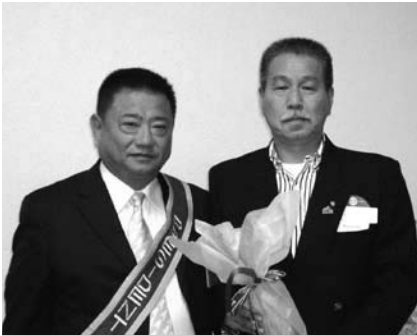
沼南RC高本会長・八木会員