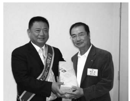
沼南RC高本会長・野田会員