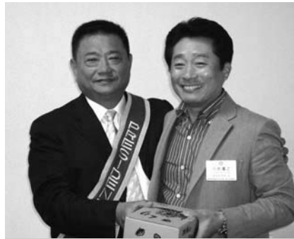
沼南RC高本会長・小池会員