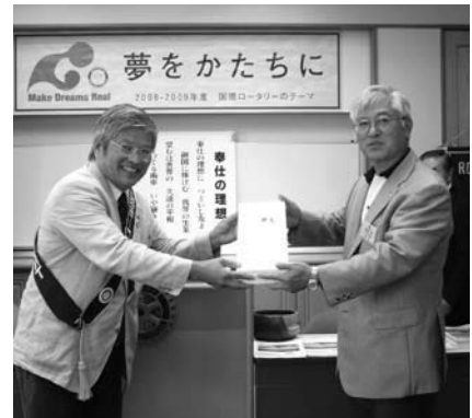
10月10日結婚40周年 星野会員