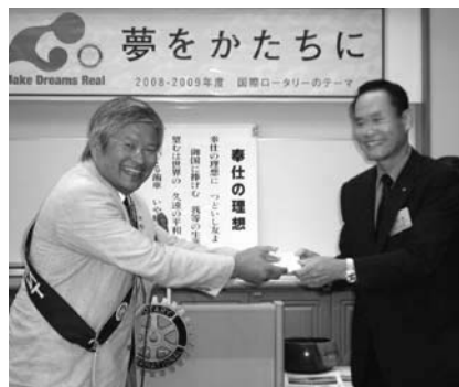
10月2日誕生祝 高島会員