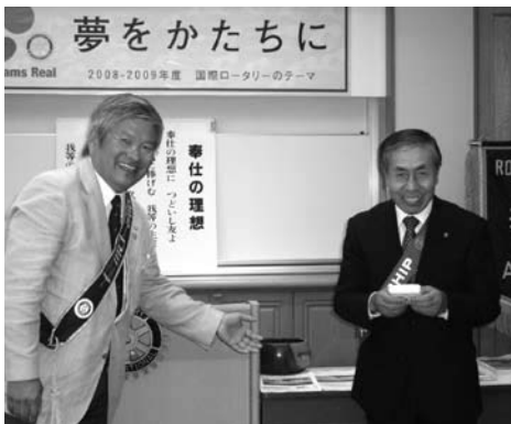
10月29日誕生祝 立野会員