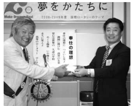
10月15日誕生祝 小池会員