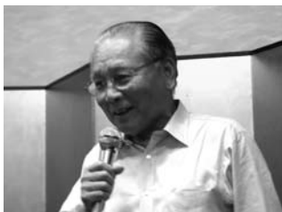
久々熱唱中！ 渋谷会員