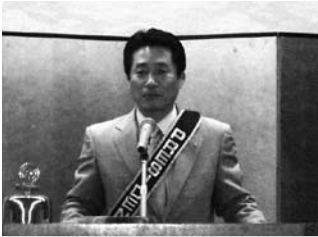
最後の会長挨拶 小池会員