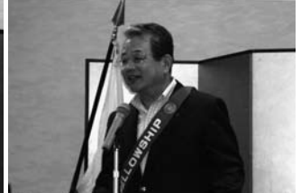
親睦委員会総括 塩毛会員