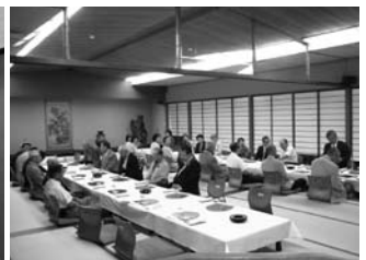
最終例会風景 鈴木屋本店にて