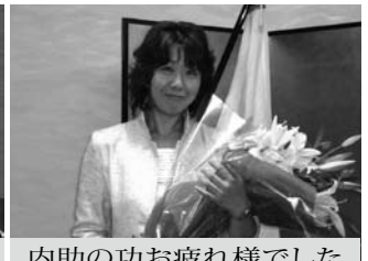
内助の功お疲れ様でした 小池会員夫人