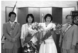
1年間お疲れ様でした！