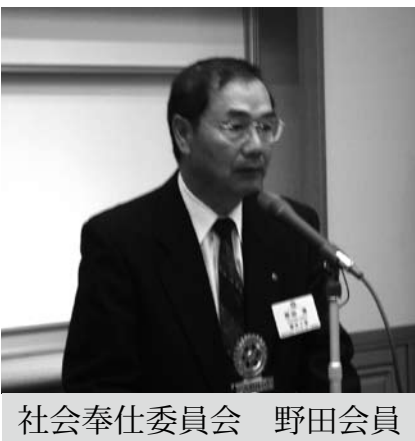
社会奉仕委員会 野田会員