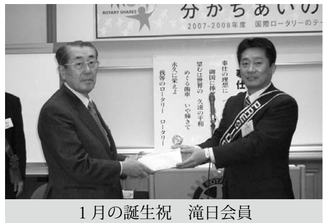
1月の誕生祝 滝日会員