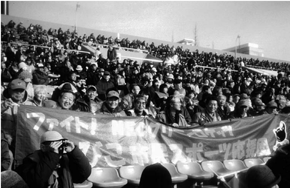
NECグリーンロケッツ 対 東芝ブレイブルーパス戦 ラグビートップリーグ 1月19日 秩父宮ラグビー場