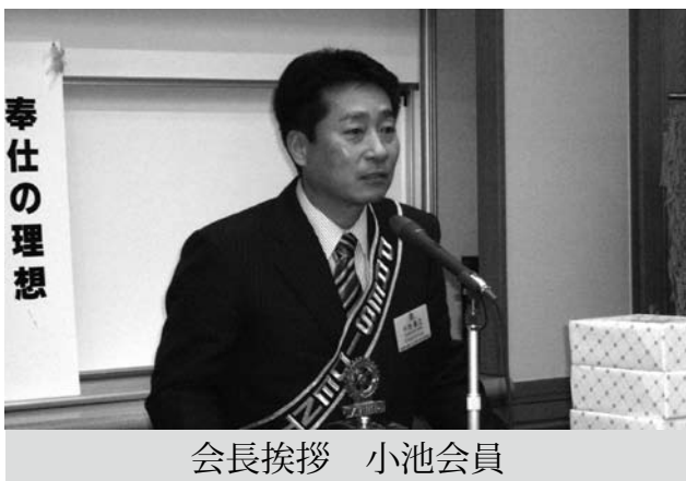
会長挨拶 小池会員