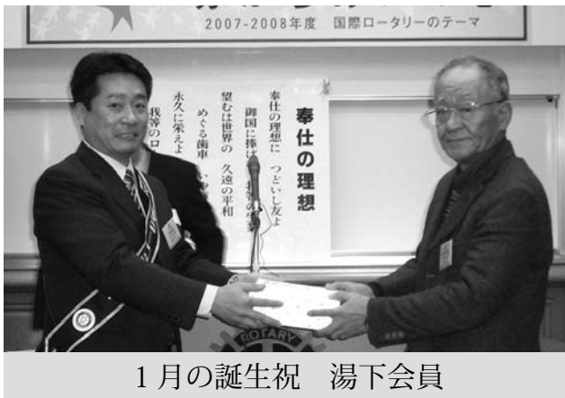
1月の誕生祝 湯下会員