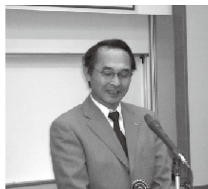
柏南 RC 大内ガバナー補佐幹事就任挨拶