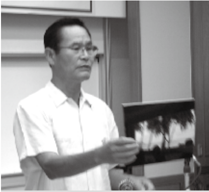
高島会員よりアラモアナ RC 訪問報告