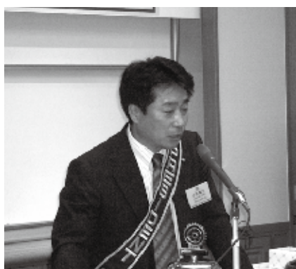
小池会員 会長挨拶