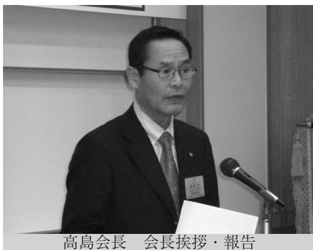
高島会長 会長挨拶・報告