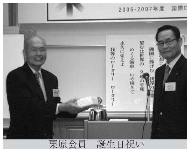
栗原会員 誕生日祝い